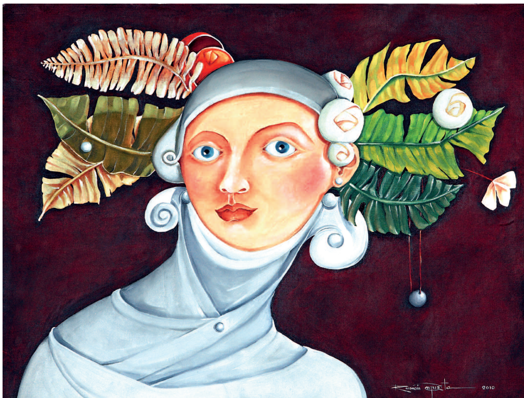
Maria Inmaculada, 2010